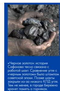
«Черное золото»: история Сафонова тесно связана с работой шахт. Сравнение угля с «черным золотом» было штампом советской эпохи. Позже шахты закрыли из-за низкого КПД угля. Тем не менее, в городе бережно хранят память о горняках.