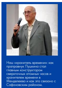
Наш «хранитель времени»: как праправнук Пушкина стал главным конструктором сверхточных атомных часов и хранителем времени в Менделеево и как это связано с Сафоновским районом.

Глоссарий: объяснение терминов и понятий, связанных с городом и его особенностями.